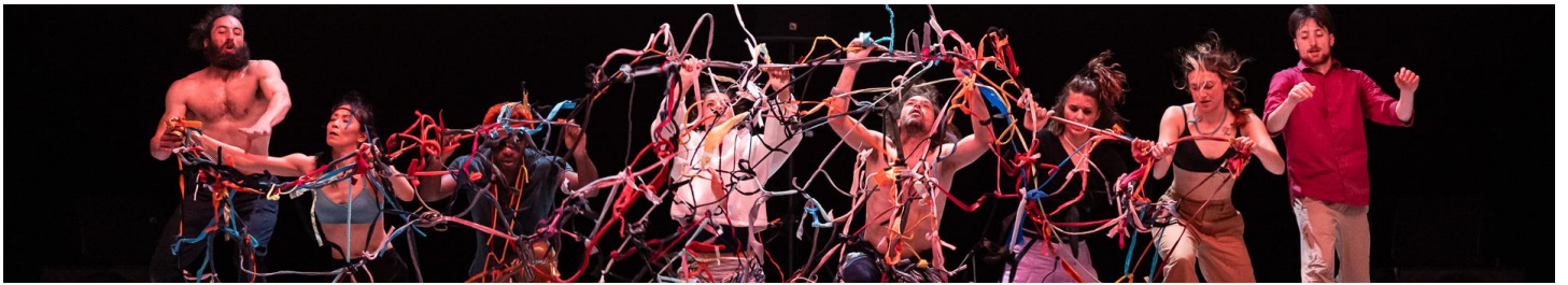
Image d'une ronde où jamais les corps ne se rejoignent, allégorie d'une étendue marine peuplée de fantômes hypnotiques, évocation d'un bal explosif pour des troubadours d'un nouveau genre, ou encore, intrusion dans un salon d'essayage à l'ambiance festive où les tissus volent et les costumes s'échangent sans vergogne.

Au cœur de cette succession de paysages fantasques, des moments de solitude bégaient parfois le désarroi de l'un ou la révolte de l'autre. L'atmosphère sonore est alors plus rugueuse et la vélocité animale qui se dégage des corps est saisissante.